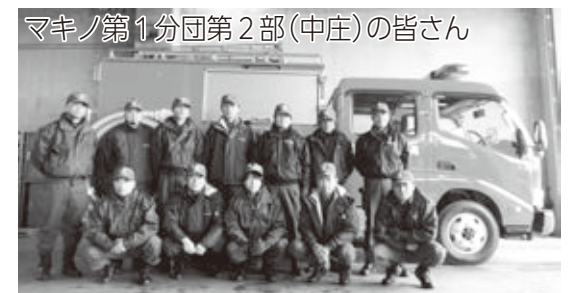
マキノ第1分団第2部（中庄）の皆さん