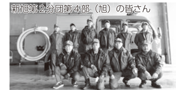
新旭第2分団第4部（旭）の皆さん