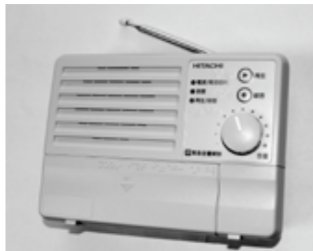
▲デジタル対応の新しい戸別受信機

・ 【売買、相続などをしたとき】 ・ 法務局で「所有権移転登記」の手続きをしてください。売買契約済または相続協議済で