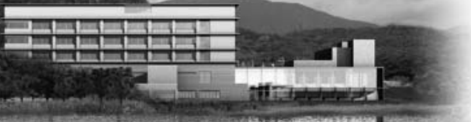
▲新病院の完成イメージ（東方向乙女が池側からの眺望）