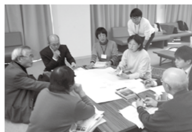
▲グループワークの様子