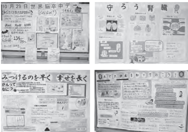
毎月各部署が交代でポスター掲示をしています

「医療・看護に関する情報ポスター」を知っていますか？ 高島市民病院1階エントランスホールに掲示している「医療・看護に関する情報ポスター」をご覧になったことはありませんか？ 情報ポスターには、病気に関することやケガの応急処置方法など、各部署が専門とする内容を分かりやすく掲載し、工夫を凝らしながら作成しています。 情報ポスターは、高島市民病院内健診センターにも掲示しています。ぜひご覧いただき、健康管理にお役立てください。