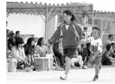
小中学校の交流(今津北小学校運動会)