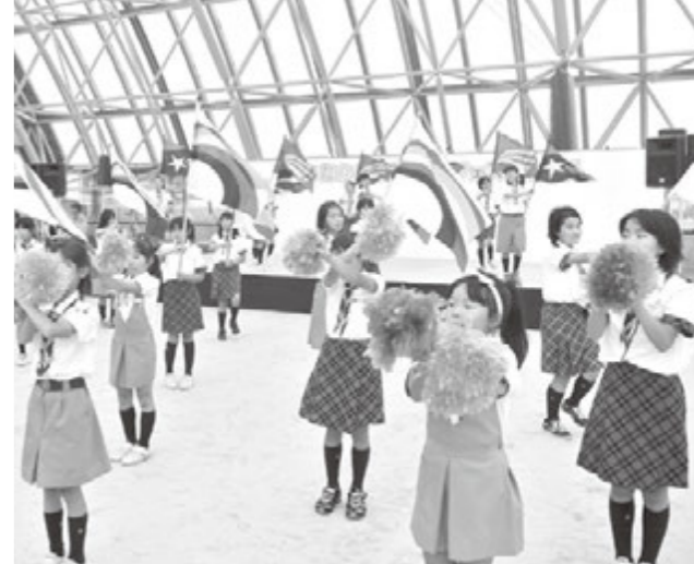
ガールスカウト湖西地区協議会によるカラーガード

約1,500名の方にご来場いただき、青少年関係団体によるステージ発表のほか、体験コーナーや食べ物コーナー、警察・消防車両の展示コーナーなどを行い、子どもから大人まで笑顔のあふれるフェスティバルとなりました。(青少年課)