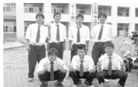
高島高校ボート部の皆さん