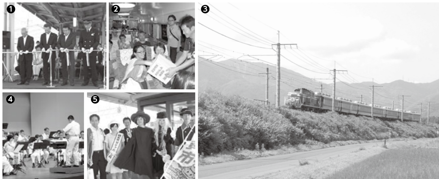
①近江今津駅で行われた市民号出発式でのテープカット ②記念列車では、おみやげの抽選会などイベントも。 ③市民約200人を乗せ中庄付近を走行する市民号 ④市民会館で行われた自衛隊中部方面音楽隊による記念コンサート ⑤敦賀駅で出迎えてくださった敦賀市観光協会職員や観光キャンペーン隊