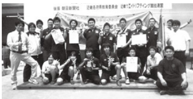
安曇川高校ウエイトリフティング部の皆さん