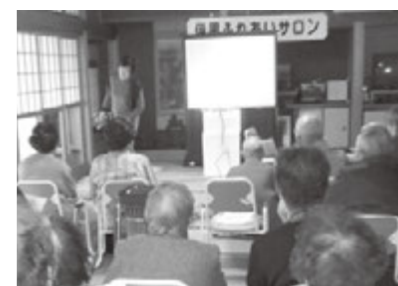
養成講座に参加される自治会の皆さん

市では、認知症の方が住み慣れた 地域でその人らしくいきいきと暮ら すことができるまちづくりを進める ために、認知症についての正しい知 識やつき合い方について学ぶ住民講 座「認知症サポーター養成講座」を 開催しています。