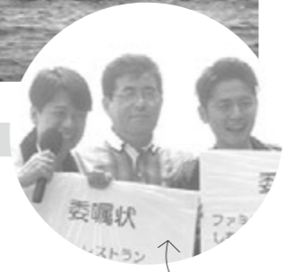
たかしま特命観光係に任命されたファミリーレストランのお二人(写真左右)