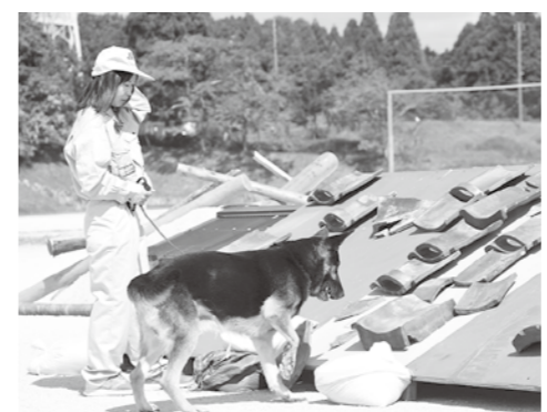
救助犬による救出訓練

また、防災課では、皆さんからのお申し込みにより『防災出前講座』を実施していますので、ぜひご利用ください。(防災課)