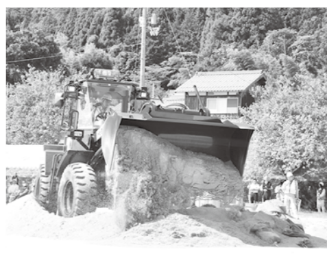
土砂除去作業実動訓練