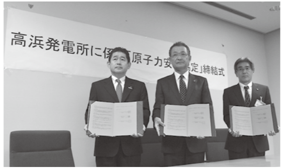
協定を締結(滋賀県立会い)

経緯としては、福井県内に所在する原子力発電所について、平成25年4月5日に安全協定を締結しましたが、隣接地に位置する高浜発電所のみ安全協定の締結に至らず、継続協議となりました。