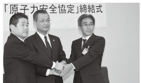
関西電力(株)と市と滋賀県とで固い握手

今後は、協定書に定められた内容をしっかりと運用するとともに、皆さんの安全・安心につながるよう、分かりやすい情報提供を行います。(原子力防災対策室)