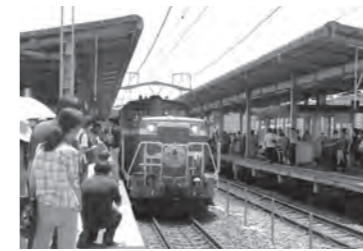
7月 JR湖西線開通40周年記念イベント