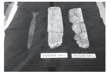
8月 上御殿遺跡から双環柄頭短剣の鑄型が出土