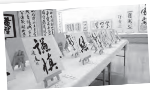
8/23～25 夏輝書展 (NPO法人心のふるさと書道会)