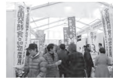
12月 全国発酵食品サミット in たかしま開催