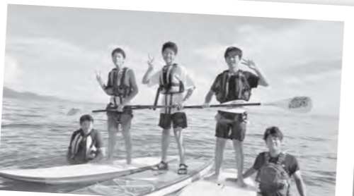
8/25～26 中高生と未来を語ろう 夏休み最後の日曜日チャレンジ (NPO法人コミュニティネットわーく高島)