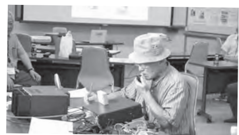
8/4、18、25 アマチュア無線局体験運用会 (いちろくいちクラブ)