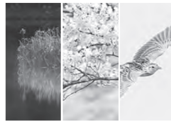
10月 高島市のシンボル(花・木・鳥)を制定