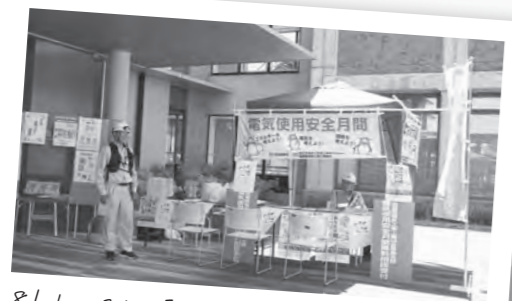
8/1～31 電気使用安全月間 (滋賀県電気工事工業組合高島支部)