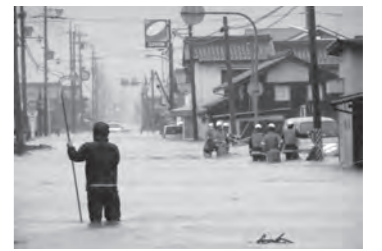
9月 台風18号による豪雨によって鴨川が決壊