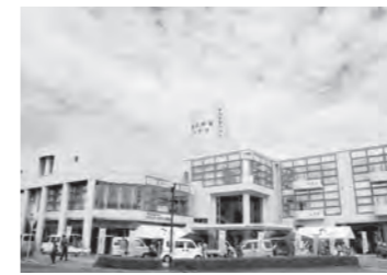
10月 「高島市観光物産プラザ」開設