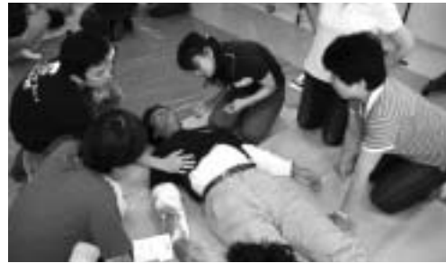
▲8月1日(土) トリアージ研修会 (安曇川ふれあいセンター)

滋賀県では湖南、湖東を中心にこれまで7つの病院が災害拠点病院に指定されていますが、湖西地域にはありませんでした。琵琶湖西岸断層帯が存在する高島市では地震等の災害対策が大きな課題です。このため今回の新築工事にあたっては、「災害拠点病院としての機能強化」を最も重要な整備方針の一つとしています。