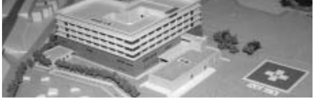
★新病院とヘリポート（院内展示中の模型より）

現在、公立高島総合病院では新築工事の準備をすすめるとともに、実際の医療の現場においても救急医療・災害対策の各種研修会や訓練を定期的に行い職員能力向上に努めています。今後ともご支援ご指導をお願いします。