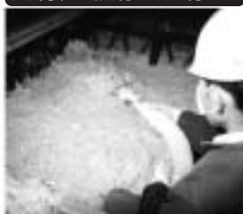
床下に断熱ボードを取り付ける