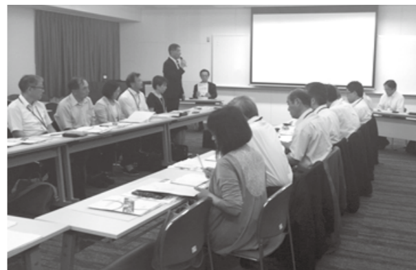
活発な意見交換が行われました

今回の集落座談会を通して、集落活動のあり方、いざという時の備えや支え合い方など、これからの集落活動をより良いものにするための意見交換がされ、区民一人一人の気づきの場面を創出されました。