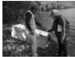
▲こんな大きな大型冷蔵庫が漂着!!

びわ湖トラストは、びわ湖の集水域(山・里)からびわ湖まで、現状を捉え、研究者も市民も共に連携して活動する場として、2007年から活動を始めました。2008年「びわ湖環境あしなが基金」を設立し、具体的に研究を支えたり市民参加で湖底ゴミの引き上げ調査を行っています。