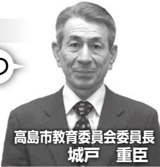
高島市教育委員会委員長 城戸 重臣