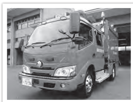
令和3年度饗庭野演習場等周辺消防施設設置助成事業を活用

災害が発生した場合に、いち早く現場へ駆け付け、皆さんの安全安心を守ります。（消防本部警防課）