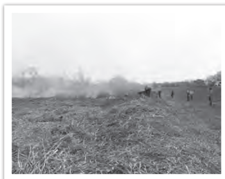
ヨシの火入れのようす

早春の訪れを告げる炎やヨシの火入れのようすを市内外から来られた多くの見学者の皆さんが見守っていました。（環境政策課）