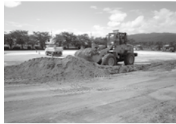
マキノ中学校グラウンド

建設業協会の善意でグラウンドを整地 滋賀県建設業協会高島支部のご厚意により、夏休みにマキノ中学校と今津中学校のグラウンドを整地していただきました。ありがとうございました。