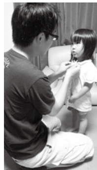
最優秀賞 「パパと お着替え」