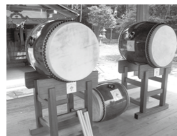
青柳区で整備した和太鼓

地域づくりのために交付される宝くじの助成金を受け、青柳区(安曇川地域)では和太鼓の整備が行われました。この事業はコミュニティ活動の健全な発展を図るとともに宝くじの普及広報活動を行うもので、コミュニティ活動に必要な施設や備品を整備する事業に助成されます。