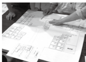
避難所運営ゲーム

内6地域の公民館ごとに、全3回の講座を実施しました。 第1回は、防災リーダーの役割や自主防災組織について、第2回は、安曇川町藤江区の防災組織の取り組み紹介と災害図上訓練(DIG)を、第3回は、避難所運営ゲーム(HUG)を体験していただき、3回とも参加していただいた方には、修了証をお渡ししました。 今回の研修を受けられた防災リーダーが、研修で学ばれたことを地域で実践していただけたらと思います。