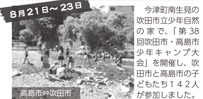
8月21日~23日 高島市⇄吹田市 今津町南生見の吹田市立少年自然の家で、「第38回吹田市・高島市少年キャンプ大会」を開催し、吹田市と高島市の子どもたち142人が参加しました。最初はみんな緊張したようでしたが、班のメンバーと協力しながら川遊びや野外炊事など、さまざまな体験にチャレンジしていく中で、徐々に打ちとけ、高島の夏をおもいきり楽しんでいました。(青少年課)