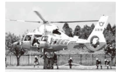
←給水訓練のようす