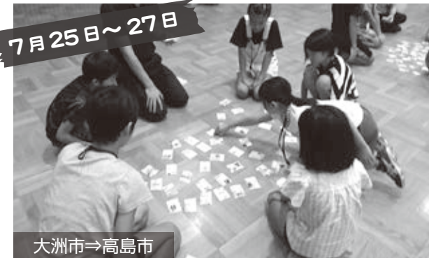
大洲市⇒高島市 藤樹かるたで交流

愛媛県大洲市の小学6年生が高島市を訪れ、「よえもん道場」に参加している市内の小学4~6年生と「藤樹かるた」や「ミニ掛け軸づくり」で交流を深めました。(青少年課)