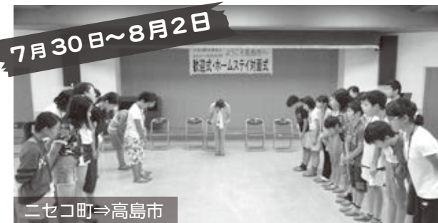
7月30日~8月2日 ニセコ町⇒高島市 交流会「よろしくお願ひします!」

北海道ニセコ町の小中学生が高島市を訪れ、市内の小中学生とのレクリエーション交流をはじめ、ブルーベリー狩りや石窯でのピザ作り、カヤックなどの体験活動を行い、ホームステイでは市内の子どもの家庭で楽しい一夜を過ごしました。(高島市青少年育成市民会議)