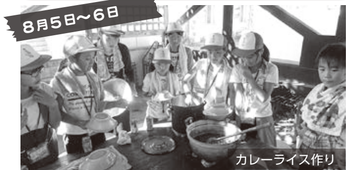
8月5日~6日 カレーライス作り 富士キャンプに向けて、勝野のびわ湖青少年の家で、1泊2日の事前研修を行いました。野外炊事では、班のメンバーで協力して、カレーライスを作りました。また、キャンプ当日の役割決めや、キャンプファイヤーでの出し物の練習など、楽しい富士キャンプになるように、子どもたち一人一人が積極的な姿勢で活動に参加している姿が見られ、団結が深まりました。 ※8月24日からの3泊4日で予定をしていた「富士キャンプ」は残念ながら台風の影響で中止となりました。(高島市青少年育成市民会議)