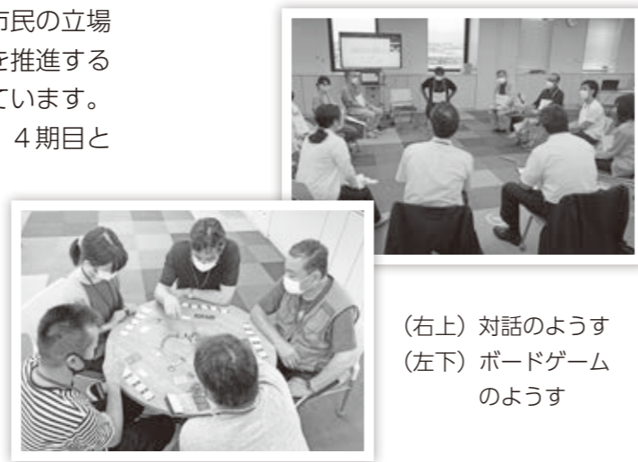
(右上) 対話のようす (左下) ボードゲームのようす

今後、市民委員と市職員が議論を交わしながら2年間の活動を行っていきます。(市民協働課)