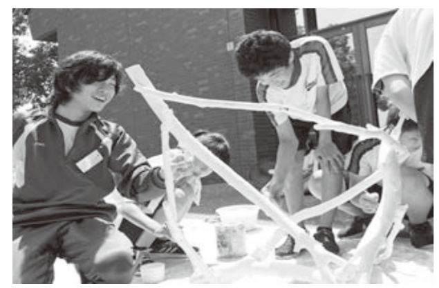
楽しそうに作品を作る参加者

7月25日(水)から27日(金)まで、藤樹の里文化芸術会館で「キッズアート 2018」を開催しました。今年は「自然と風のファンタジー」と題して、造形活動を通じて風の力を学習しました。 また、本年度は市内の他に津市や福井県からの参加も合わせて13校35人が参加し、完成した作品は、8月19日(日)まで、藤樹の里文化芸術会館の展示室1に展示されていました。(藤樹の里キッズアート事業実行委員会)