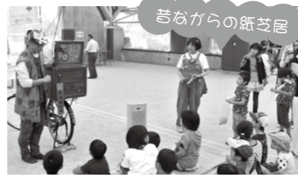
昔ながらの紙芝居