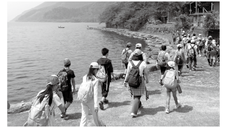
↑永原駅からマキノサニービーチまで歩きました

6月13日(土)には、2回目の活動「びわ湖・湖岸ウォーク」を行いました。体験活動の一環として子どもたちが自ら切符を購入し、自宅の最寄り駅から電車に乗って永原駅に集合。永原駅から琵琶湖岸をマキノサニービーチまで歩きました。約10kmの暑くてつらい道のりでしたが、参加者全員が頑張っ完歩しました。初夏の景色と心地よい風は疲れを吹き飛ばしてくれました。(高島市青少年育成市民会議)