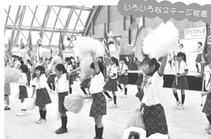
いろいろなステージ発表