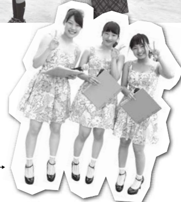
私たちが司会を がんばりました!