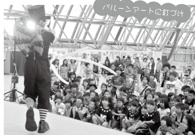
バルーンアートに釘づけ