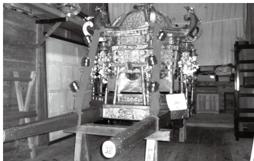
井ノ口区(御輿の修繕)