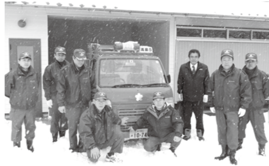
2月24日(日)、小雪の降る中、井川消防団長、宮野副団長はじめ地元の消防団員出席のもと、黒谷消防車庫への納車式が行われました。