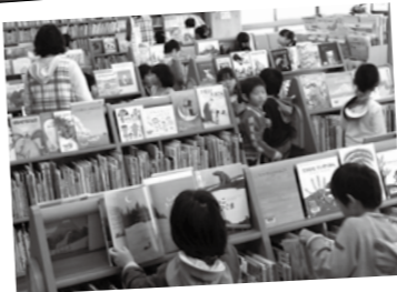
←図書館では、子どもと本をつなぐ「本の森探検」事業を実施しています。