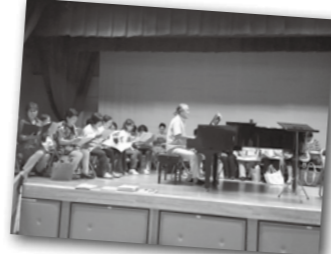
合唱の練習もはじまりました