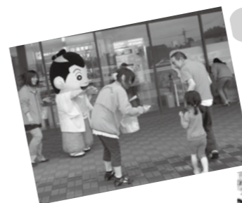
よえもんくんやおはよちゃんも参加します♪