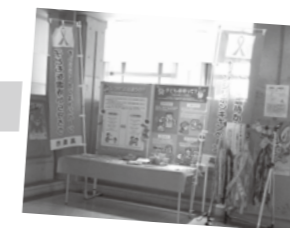
チラシ、パンフレット、オレンジリボン等の配布やのぼり旗を設置します。