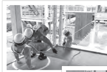
（上）ロープブリッジ救出のようす

あらゆる災害から皆さんを守るため、これからも消防救助技術の向上に努めます。（消防本部警防課）