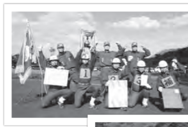
（上）出場団員の皆さん