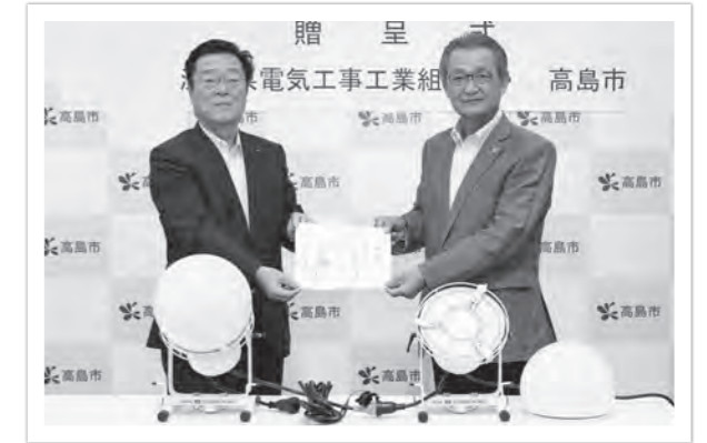
昨年ご恵贈いただいたディスクボールと連結した利用も可能

市では、地震・風水害・原子力災害などのリスクに対し、日頃から災害用資機材などの整備・備蓄を進めており、今回ご恵贈いただいた資機材についても、災害発生時に有効活用させていただきます。（防災課）