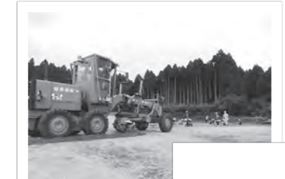
グラウンド整備のようす

建設・土木工事のプロの技によって、両校のグラウンドがきれいに生まれ変わりました。（学事施設課）