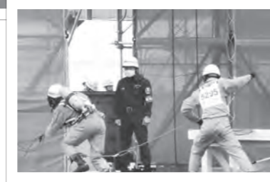
（下）ほふく救出のようす