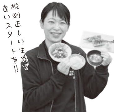
規則正しい生活でいいスタートを！！

睡眠や趣味などで休養をとることは、心身の疲労を回復し活力ある状態に戻す「休む」こと、明日に向かってのやる気を「養う」ことになります。新年を迎え、仕事やさまざまな活動に新たな気持ちで励む中、休養の時間も大切に規則正しい生活を送りましょう。