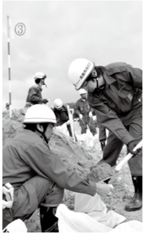
土のうを作る消防団員。