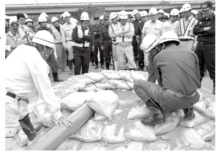
土のうの積み方の一つ「釜段工」。実際に水を入れて、出来具合をチェック。

他にも、県防災ヘリコプターによる孤立者救助の訓練や、県建設業協会高島支部による水のう工の訓練も行われ、水害に備えました。(秘書広報課)