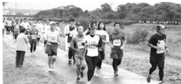
知内川サイクリングロードを快走!