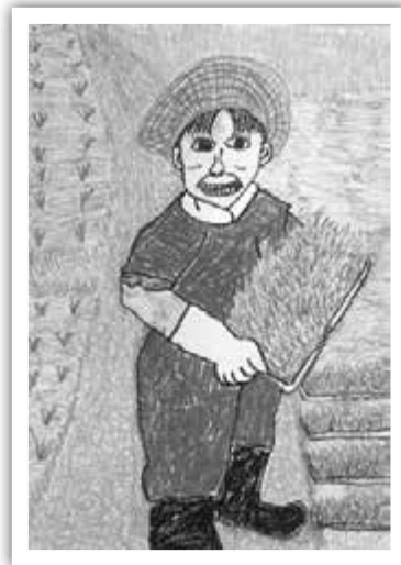
【滋賀県世代をつなぐ農村まるごと 保全推進協議会高島支部長賞】