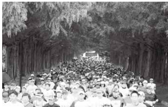
ハーフマラソンスタート直後のメタセコイア並木