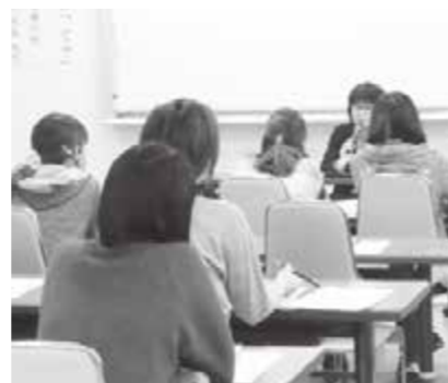
熱心に話を聴く参加者

今後は、1月20日(土)に、「就学に向けて家庭でできる環境づくり。読み書きを覚えるまでに家庭でしておきたいこと。」をテーマに、ことばの教室の先生にお話しいただきます。(健康推進課)