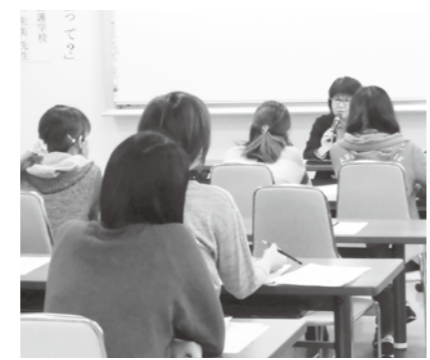
熱心に話を聴く参加者

今後は、1月20日(土)に、「就学に向けて家庭でできる環境づくり。読み書きを覚えるまでに家庭でしておきたいこと。」をテーマに、ことばの教室の先生にお話しいただきます。(健康推進課)