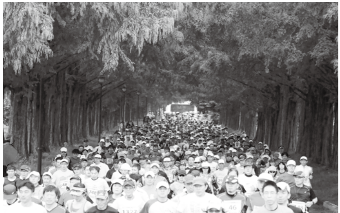
ハーフマラソンスタート直後のメタセコイア並木

10月15日(日)にマキノピックランドを主会場として、「2017 びわ湖高島栗マラソン大会」を開催しました。会場には、フルタ製菓を始めとするさまざまな出店ブースが立ち並び大きな盛り上がりを見せました。あいにくの雨模様でしたが、メタセコイア並木や知内川サイクリングロードなどのコースを、2,169人のランナーが力走されました。(市民スポーツ課)