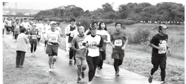
知内川サイクリングロードを快走!