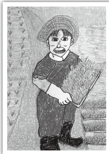
【滋賀県世代をつなぐ農村まるごと 保全推進協議会高島支部長賞】