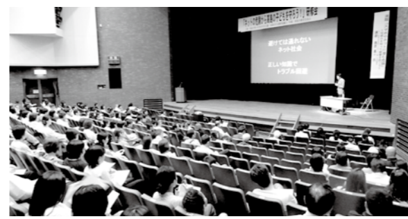
熱心に話を聞く参加者