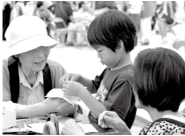
夢中でクラフト作成