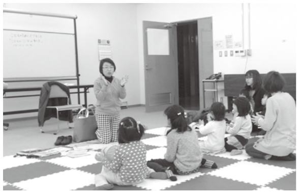
絵本による学習会