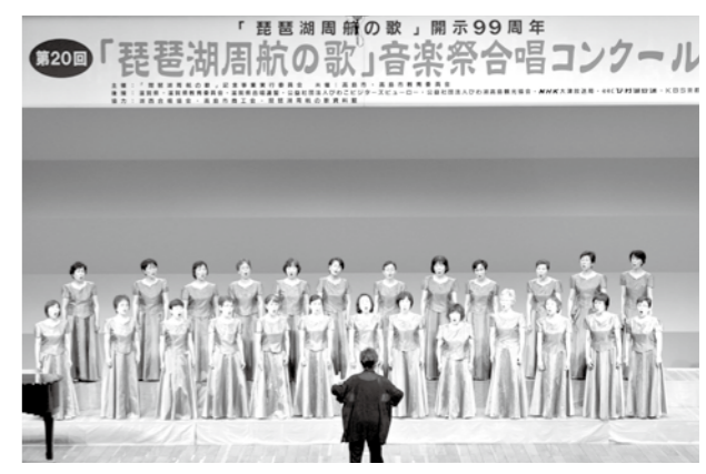
金賞 女性コーラス青の皆さん

6月26日(日)高島市民会館で、第20回「琵琶湖周航の歌」音楽祭合唱コンクールが開催されました。愛媛県松山市をはじめ、北陸、東海、近畿の各地方から参加された25の合唱団が課題曲「琵琶湖周航の歌」と自由曲で美しいハーモニーを競いました。主な結果は次の通りです。(高島市民会館)