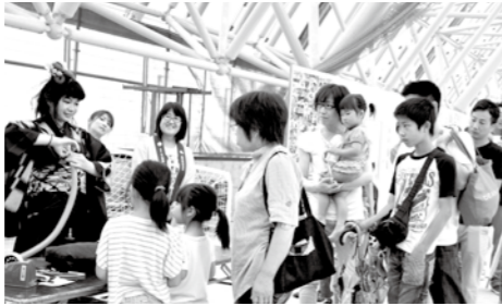
バルーンアートに大行列!