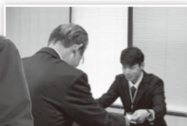
市長報告のようす