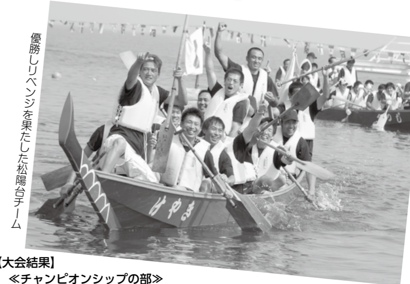
優勝しリベンジを果たした松陽台チーム

チャンピオンシップの部の優勝チーム「松陽台」は、昨年度は準優勝で涙を吞みましたが、今年は見事リベンジを果たしました。「来年は、自分達が優勝し賞金を頂く！」と思われる皆様のご参加をお待ちしています。（観光振興課）