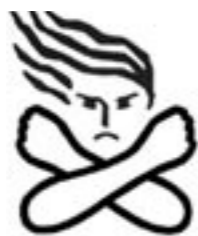
▲女性に対する暴力根絶のためのシンボルマーク

暴力は、性別、加害者や被害者の間柄を問わず、決して許されるものではありません。夫・パートナーからの暴力はもとより、性犯罪、売買春、人身取引、セクシュアル・ハラスメント、ストーカー行為等の女性に対する暴力は、犯罪であるとともに重大な人権侵害でもあります。