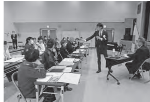
受講生との意見交流

「知る」「つながる」「踏み出す」をテーマにした市民大学たかしまアカデミーでは地域について学び、仲間とつながり、学びを生かして次に踏み出すことを目指しています。 たかしまアカデミー第1期生は24人でスタートしましたが、今後は受講生以外の方も参加いただける公開講座も予定していますので、ぜひご参加ください。