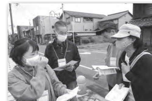
☎ 市民協働課 ☎ (25) 8526