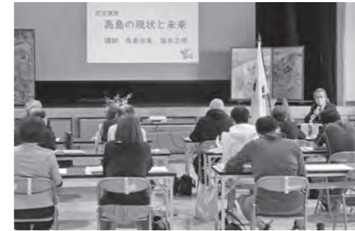
福井市長による記念講演