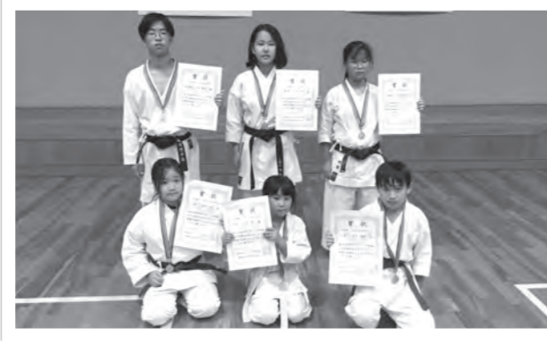
第9回滋賀県スポーツ少年団空手道交流大会 (敬称略)