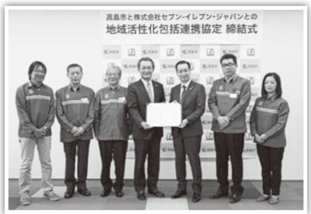
協定締結式の様子

今後は、市内9つのセブン-イレブン店舗とも協力し地域の活性化と市民サービスの向上のため、取り組みを行っていきます。(総合戦略課)