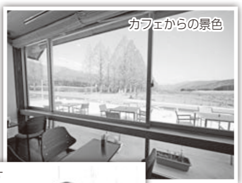
カフェからの景色

大阪市に本社を持つフルタ製菓が、琵琶湖源流域にある高島市を本業を通して応援する「地方創生」の取り組みとして、引き続き連携していきます。(総合戦略課)