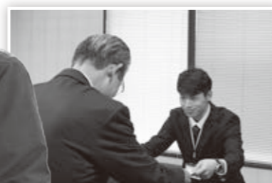
市長報告のようす