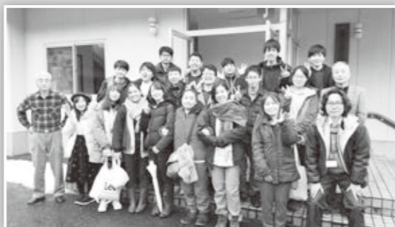
訪問された立命館大学の皆さん

大学生たちが紡ぐ言葉の一つ一つに、今回のワークキャンプで感じた楽しさや喜びが込められていて、私も嬉しい気持ちでいっぱいでした!「また来たい!!」と言う大学生たちの気持ちに期待をして、再び高島に来てくれることを待っています!