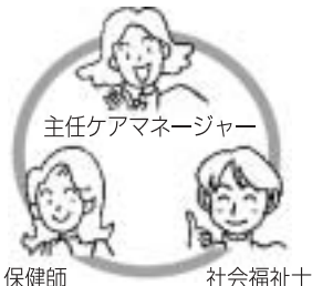
主任ケアマネージャー

地域包括支援センターは、高齢者の皆さんの介護、福祉、健康、医療などさまざまな相談の窓口です。主任ケアマネージャーや保健師、社会福祉士などがチームを組んで皆さんの支援を行います。「どこに相談したらいいのか分からない」といった悩みもご相談ください。