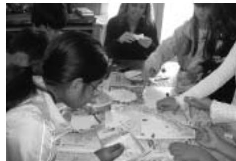
▲こどもの国での交流

10月はマリスト国際学校の5年生が来校し、餅つきをしたり、「江洲音頭」を踊ったりして、全校をあげて交流をしています。また、マリスト国際学校の子も達が書道や茶道等の日本の文化に触れる機会を作っています。6年生とはさらに、滋賀県立びわ湖こどもの