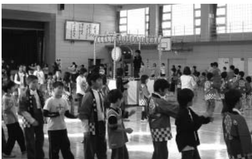
▲体育館での交流の様子

国等で宿泊をし、「貼り絵」等の共同作業を通して交流を深めています。11月には、本校の5・6年生がマリスト国際学校に出かけて学校行事に参加し、交流をしています。今年度は「国際理解教育」をさらに進めるため、外国語指導助手(ALT)に加えて、社会人講師を毎週招き、全校をあげて「英語活動」に取り組んでいます。その結果、子ども達の英語活動に対する「意欲」は益々高まっています。