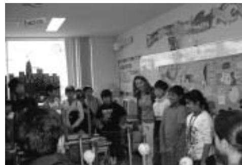
▲マリスト国際学校での様子