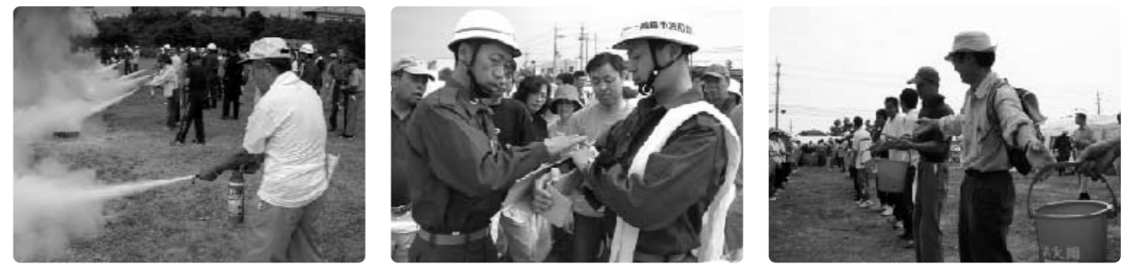
消火訓練 応急処置 バケツリレー

市では、10月29日(日)に大規模地震の発生を想定した防災訓練を実施します。今回の訓練では、地区における防災力の向上を目的に、希望される自主防災組織において避難訓練や安否確認訓練など災害直後の対応を中心とした自主防災訓練を実施していただくとともに、市職員の非常体制確立や対応能力の向上を目的として、職員参集訓練や災害対策本部を中心とする図上訓練を実施します。図上訓練とは、地図を用いて屋内で行う訓練であり、今回、この訓練手法を採用することにより、災害時における的確な判断力と適切な対策決定能力を養成していきたいと考えています。