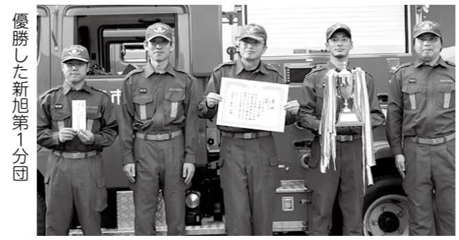
優勝した新旭第1分団