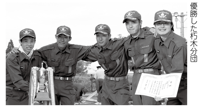
優勝した朽木分団