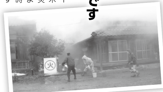
昨年度実施したマキノ町海津「宗正寺」での防火訓練のようす

市では、文化財防火デーにあわせて1月25日（日）9時から、鶴川の白鬚神社（国・市指定文化財）で、防火訓練を開催します。