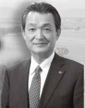
高島市長 福井 正明