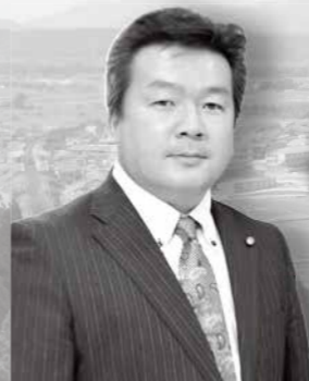
高島市議会議長 澤本 長俊