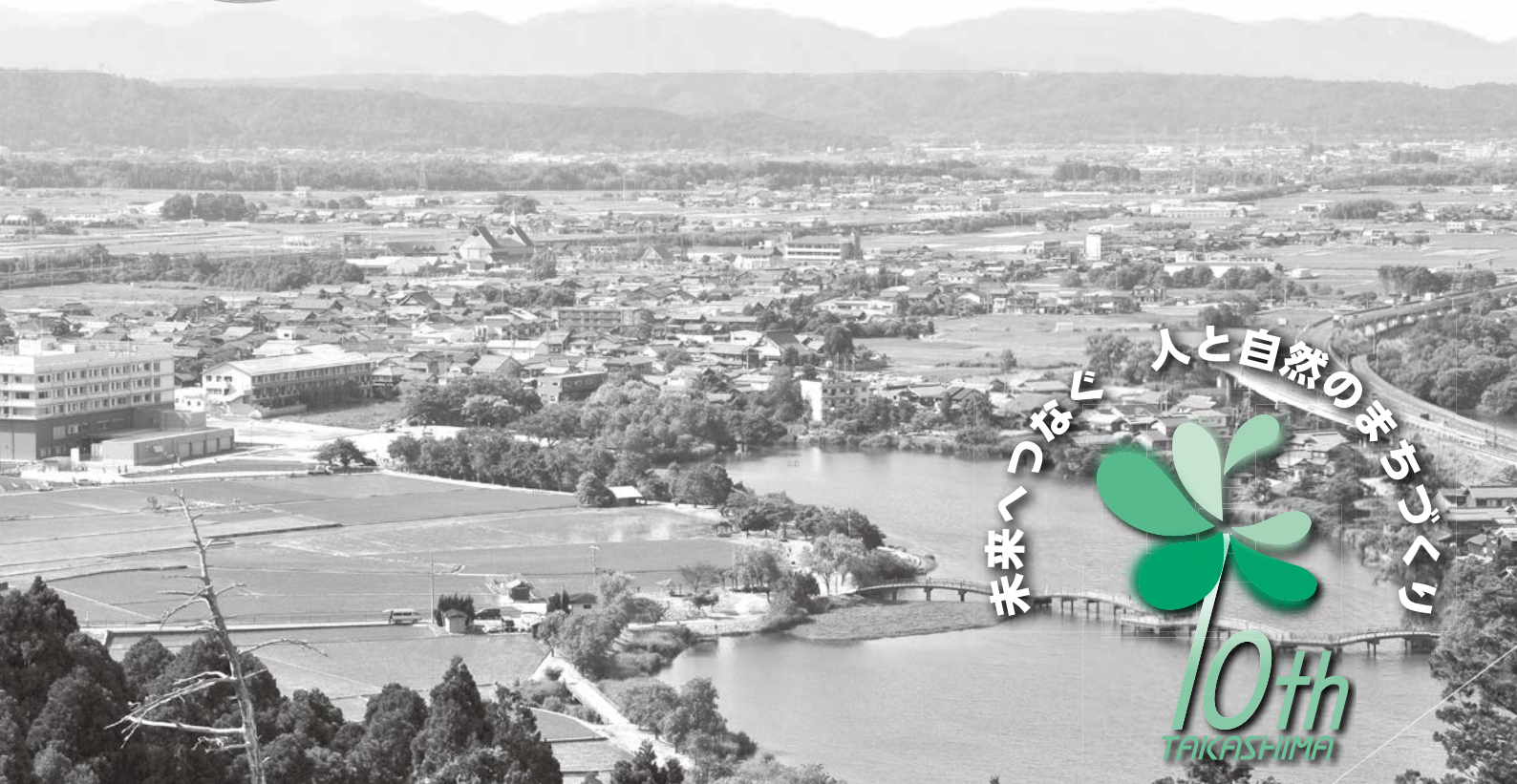
打下古墳からの眺望 (平成 26 年 11 月に答申された重要文化的景観「大溝の水辺景観」を望む)