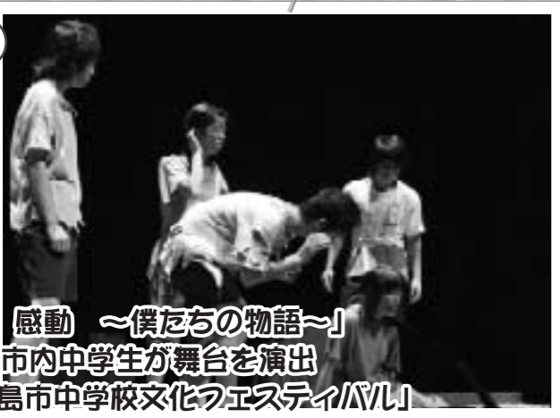
「信頼、絆、感動 ～僕たちの物語～」 をテーマに市内中学生が舞台を演出 「第7回 高島市中学校文化フェスティバル」