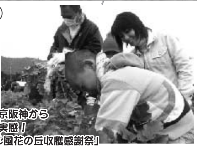
収穫体験に京阪神から 安心安全を実感! 「たいさんじ風花の巨収穫感謝祭」