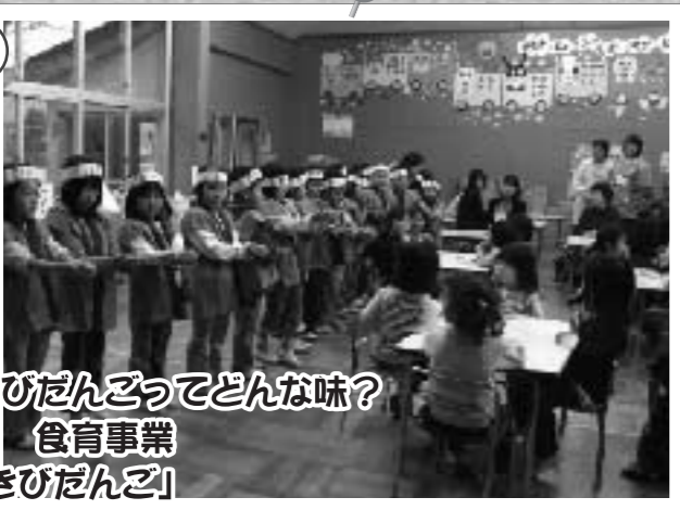
桃太郎のきびだんごってどんな味? 古賀保育園 食育事業 「桃太郎のきびだんご」