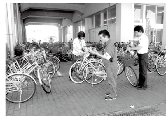
高島職域防犯協議会の皆さんの活動

また、高島職域防犯協議会の皆さんは、毎月市内の駅前駐輪場の整理・清掃活動に取り組みられています。