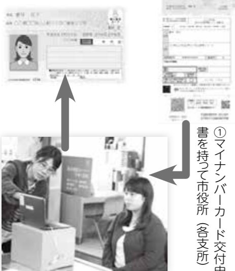
②その場で写真撮影ができます