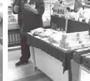
鯖寿司の魅力を語る