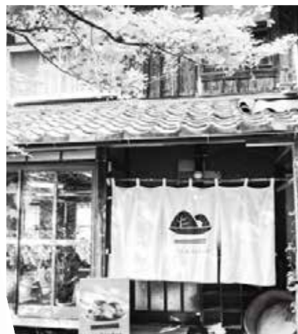
最優秀賞の sato kitchen

また、「第2回高島いいモノ・いいコトグランプリ」の表彰式が行われ、みのり農園の「sato kitchen」が見事、最優秀賞を受賞されました。(商工振興課)