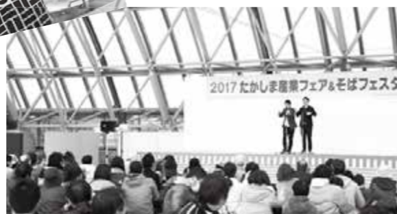
会場全員で「いらっしゃっせ〜」