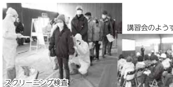
スクリーニング検査