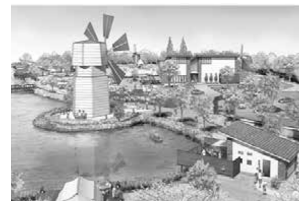
グランピング施設の完成イメージ

(企画広報課) ※グランピング=グラマラス(魅惑的な)とキャンプを掛け合わせた造語