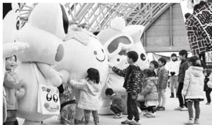
ゆるきゃらも大集合！