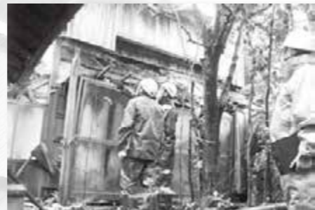
専門家と市職員による立入調査

昨年度、市内全域を対象とした空家等実態調査を実施し、1689件の空家等を確認しました。本年度は、そのうち保安上危険があるなど緊急性が高い49件について立入調査を実施しました。調査の結果を次回の空家等対策協議会に報告し、意見を踏まえ対応方針を決定します。 *特定空家等…放置すれば倒壊など著しく保安上危険な空家等