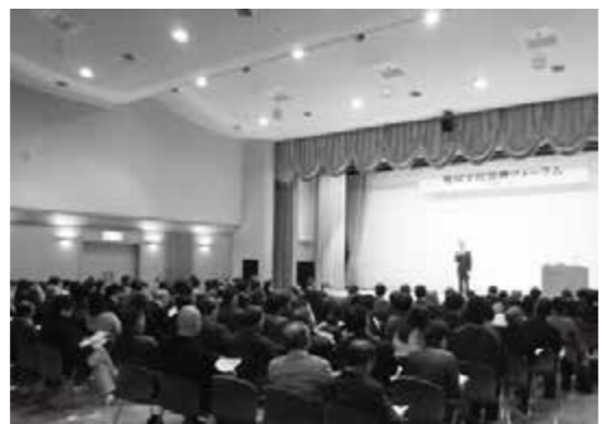
大勢の参加者が集まりました