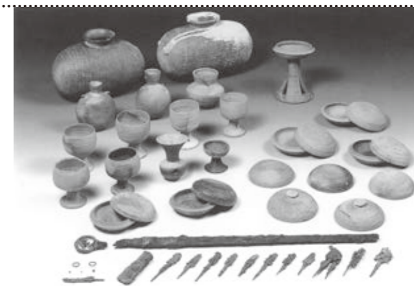
北牧野古墳群(2号墳)出土品

☎文化財課 ☎ (25) 8559 ☎ (25) 8145 ✉ bunkazai@city.takashima.lg.jp