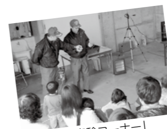
「火災再現実験コーナー」

また、悪質な訪問販売が増えています。消防職員は消火器や住宅用火災警報器を販売しませんので、ご注意ください。