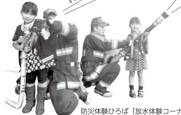
防災体験ひろば「放水体験コーナーより」

暖房器具等を使用する機会が増えるとともに、空気が乾燥し火災が発生しやすい時季を迎えます。火の取り扱いに注意してください。