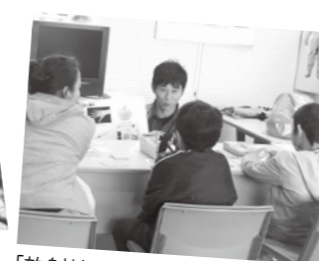
「放射線をみてみようコーナー」