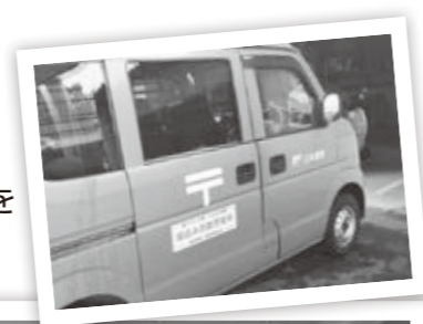
啓発ステッカーを貼った郵便車両

市にも多数相談が寄せられている「はがき」による特殊詐欺について、さまざまな機会を通して注意を呼び掛けています。