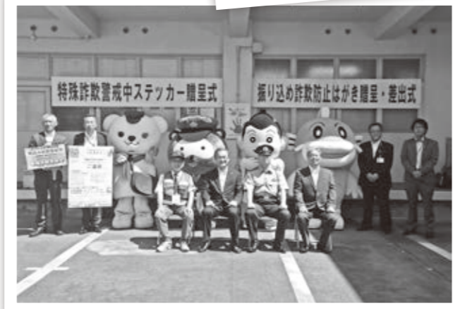
ゆるキャラも参加した式典