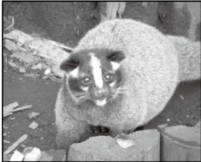
【ハクビシン】 顔の中央に白い線がある