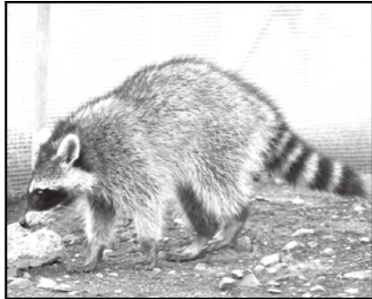
【アライグマ】 尻尾がシマシマになっている