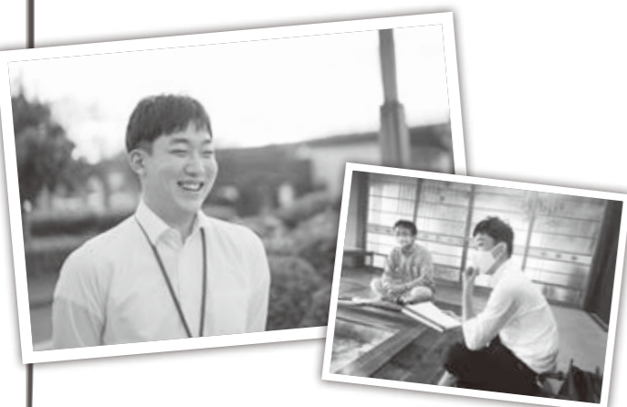
地域の方と打ち合わせ