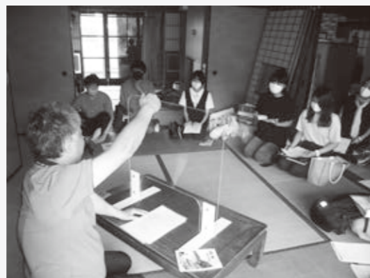
地域の方の話を熱心に聞く学生たち