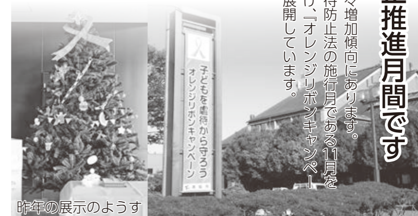
昨年の展示のようす

11月2日（月）から、市役所新館正面玄関ロビーにオレンジリボンツリーを設置します。来庁の際には、メッセージカードを飾りつけていただき、オレンジリボンツリーの完成にぜひご協力をお願いします。