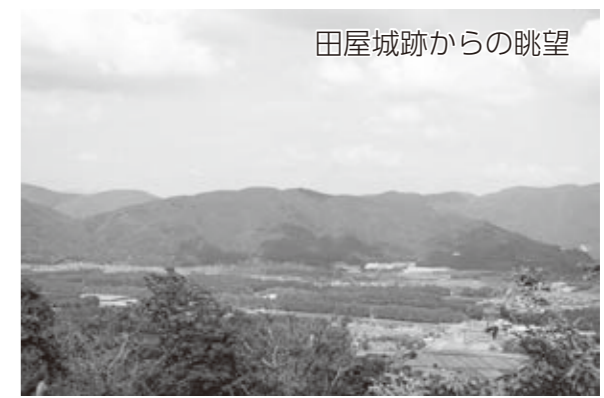
田屋城跡からの眺望

高島市に残されている戦国時代の城跡を見学し、その遺構の形状や歴史的背景から当時の城郭の魅力を楽しく学びます。