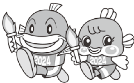
2024滋賀国体・全国障害者スポーツ大会マスコットキャラクター

この大会の機運を高めるため、広く県民に愛され、滋賀の魅力を県内外に発信できる大会の「愛称」と「スローガン」および、より多くの方々への周知を図る取り組みとして、モザイクアートポスター制作にかかる写真を募集します。詳しくは、滋賀県庁のホームページをご覧ください。下記までお問い合わせください。 ※2023年1月1日から「国民体育大会」は「国民スポーツ大会」に名称が変更されます。